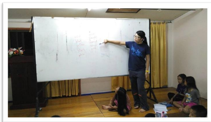
在新天學中心教學生英語