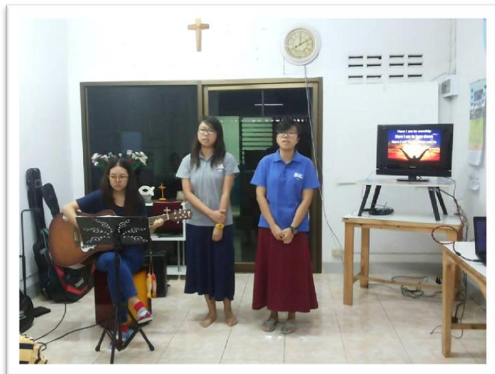
跟善如與大學生宿舍的宿生在主日崇拜中獻詩