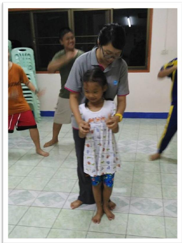
在新天學中心教學生跳舞，預備聖誕聚會