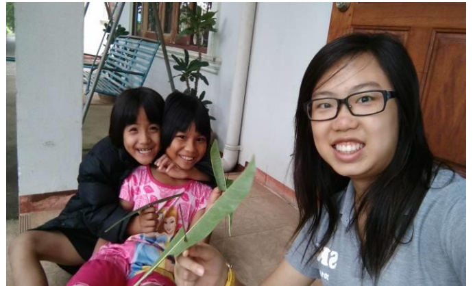
與新天之家的孩子制作樹葉風車