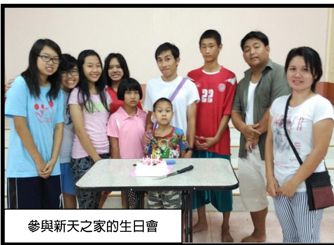
參與新天之家的生日會