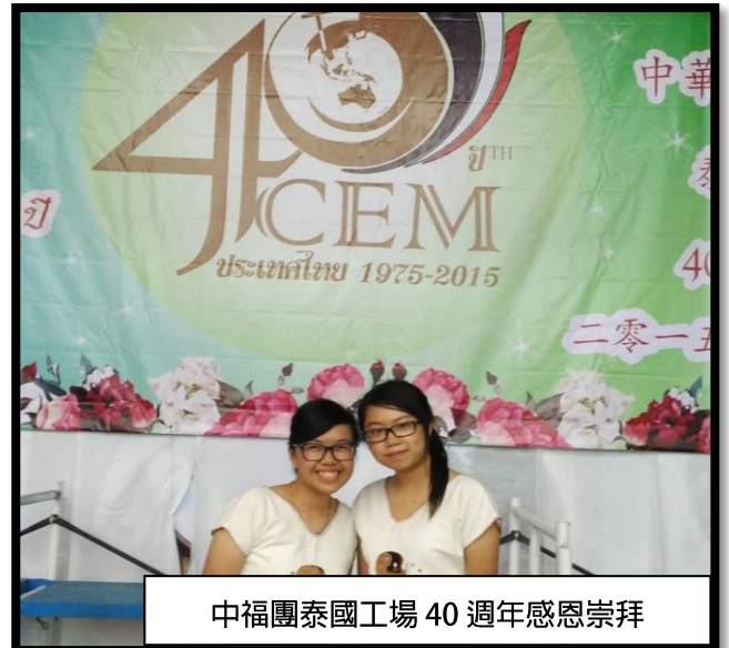
中福團泰國工場 40 週年感恩崇拜