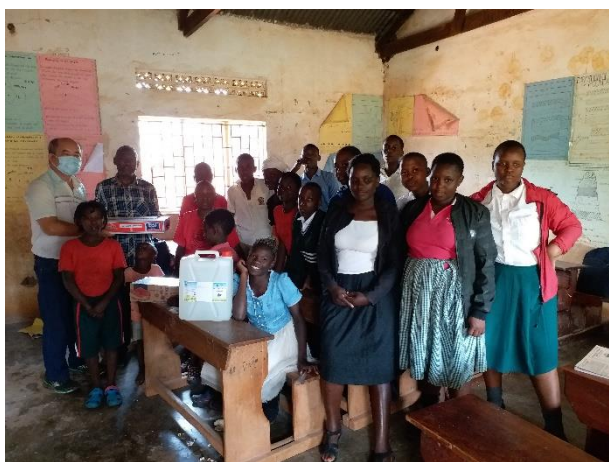
在課室與師生合影