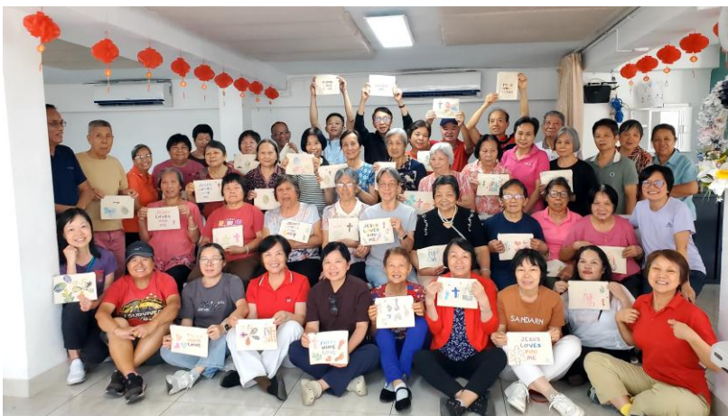
長青樂園老友記製作布袋