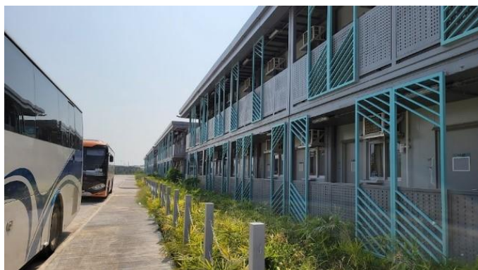
感恩新冠後第5日已轉陰性，很快便可離營