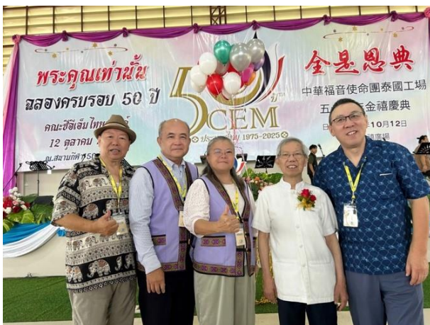
泰國退修會主日崇拜