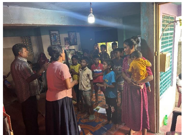
僧伽羅語詩歌敬拜