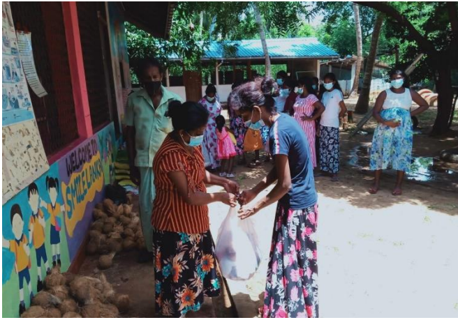
本地赤貧家庭於疫情中接受教會的物資