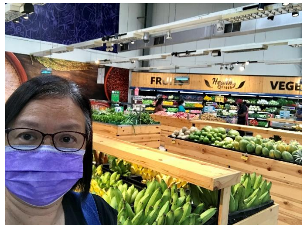
解封後可以自行購物