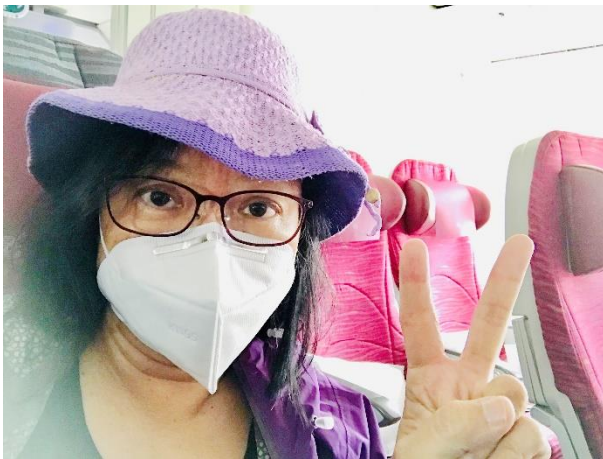
五月七日早上從科倫坡登機