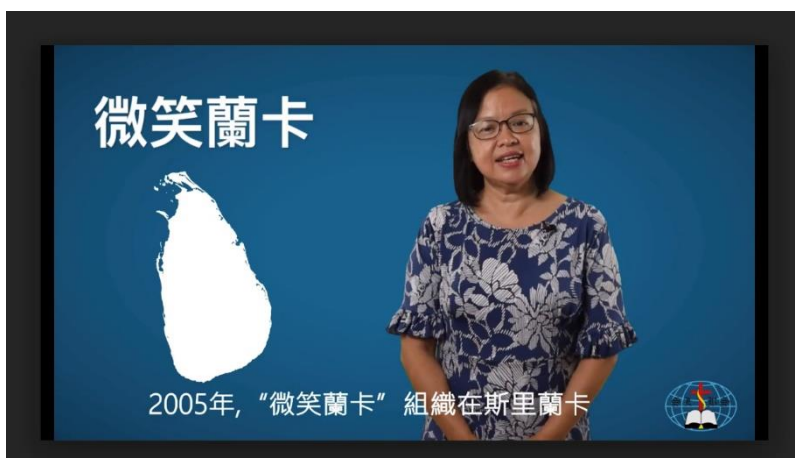
為微笑蘭卡拍攝宣傳短片