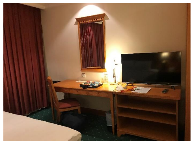
隔離酒店的工作角落