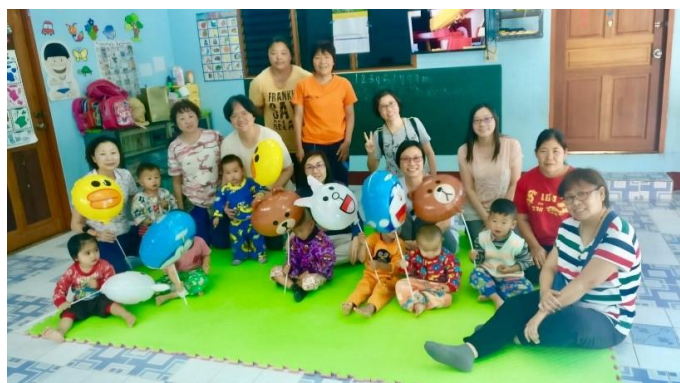
宣道會美田堂短宣隊