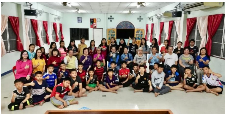
播道會恩福東九堂短宣隊

在新宿舍裡種有數棵大樹，「清掃落葉」成為日常工作之一，起初我很自然地把落葉放進垃圾袋，等清潔工來收；後來他們告訴我落葉應放回花園裡，他們不會收。我便學會把清掃了的落葉堆回樹圍上，讓它們化成濕潤土壤的天然肥料。從這項小工序，我領悟到在跨文化的生活或事奉中，不免有艱苦的時候，試問誰喜歡受苦呢？總想法子「避得就避」。然而，由這個受苦節起，求主幫助我學效主不逃避，接受那些在人看來不好的事情。因為這些「苦」將轉變為養分，壯大和強化我們的信心，勝過艱難苦楚，至死忠心追隨基督！