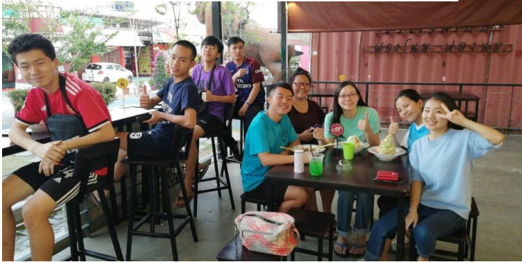
大學新宿生 (Maejo 梅州區) 與新天學生中心宿生相聚