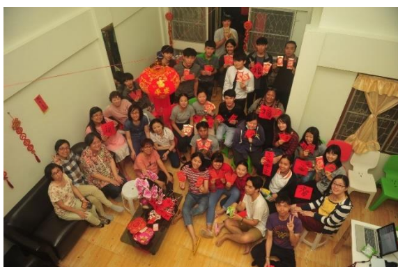
農曆新春中國之夜佈道會 (清邁區大學宿舍)