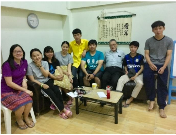
宿生聚會(於清邁大學區宿舍)