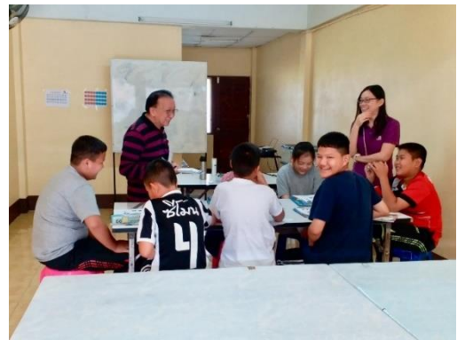
恩福東九堂短宣隊員教授普通話