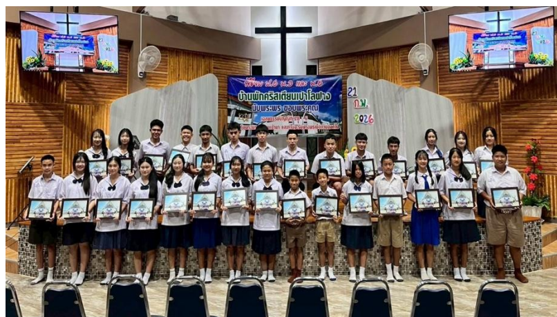
學習有時 畢業有時