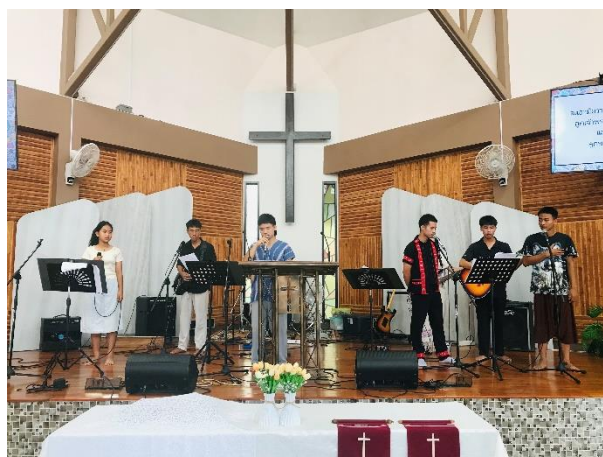
訓練同學帶領敬拜