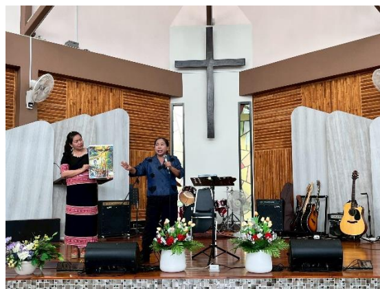
在家長會上 向家長傳福音