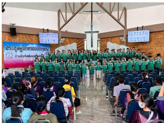
家長有機會欣賞孩子的表演