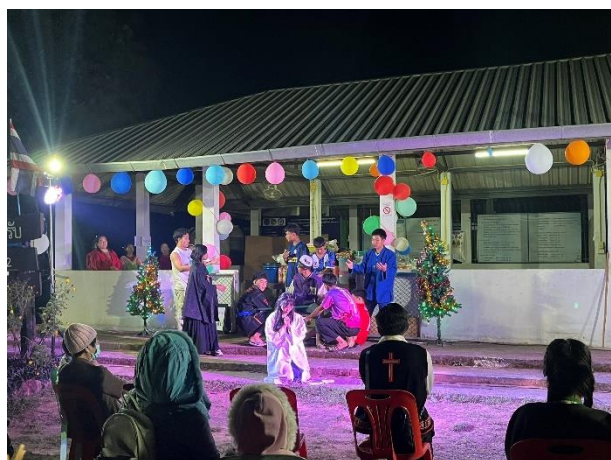
聖誕活動戲劇表演