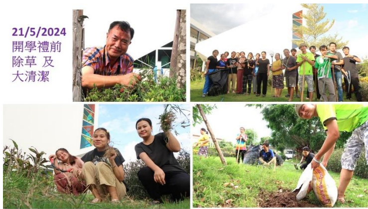
21/5/2024 開學禮前 除草及 大清潔