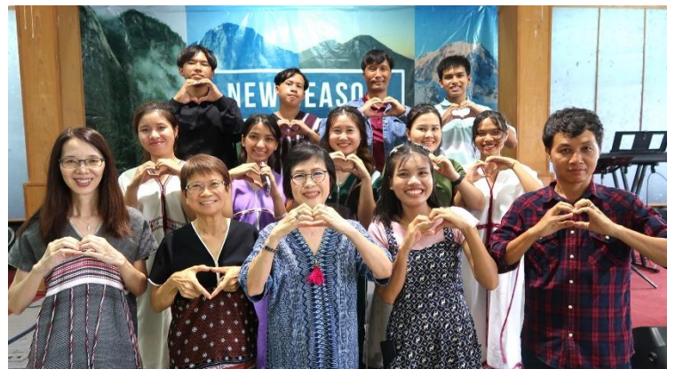
帶領一年級新生到不同教會崇拜及訪問牧者