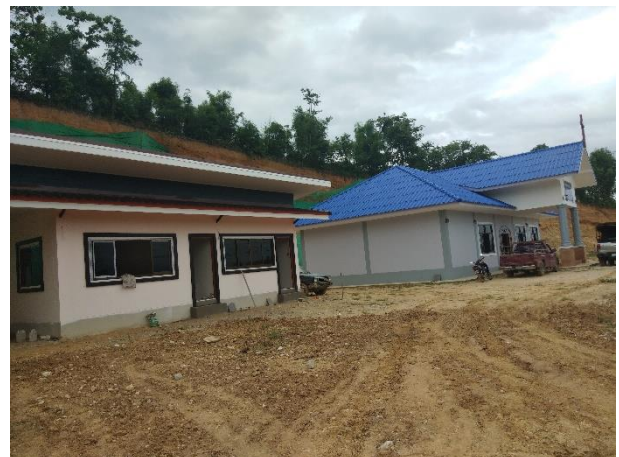
光華活石堂副堂及禮拜堂