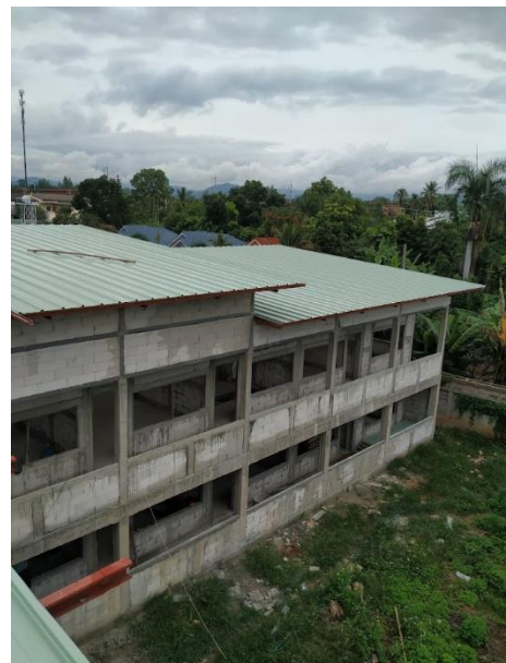
郭誠學生中心女生宿舍全貌