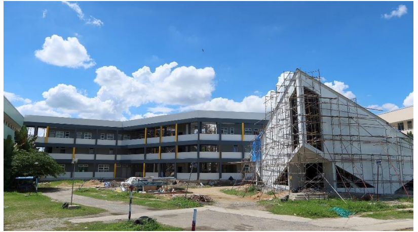
新天聖經學院第二期建築工程