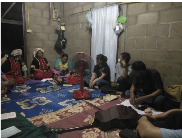
朗利佈道所信徒通宵祈禱會