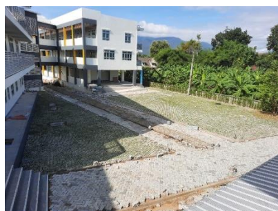
這部份地面已鋪了磚及草