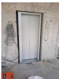
電梯已裝妥 待鋪牆磚