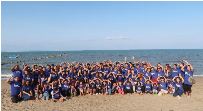
本地同工家庭跨省大旅行