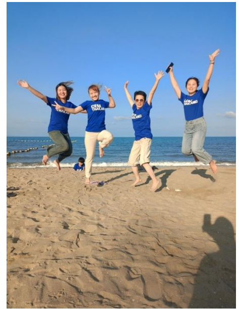
奔跑跳躍返老還童