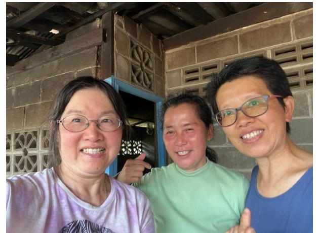
燕訪艷芳 禱告同行