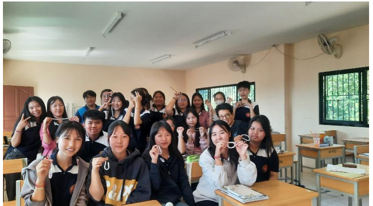
同學們的聖誕金句鏈子 是各自的精心製作