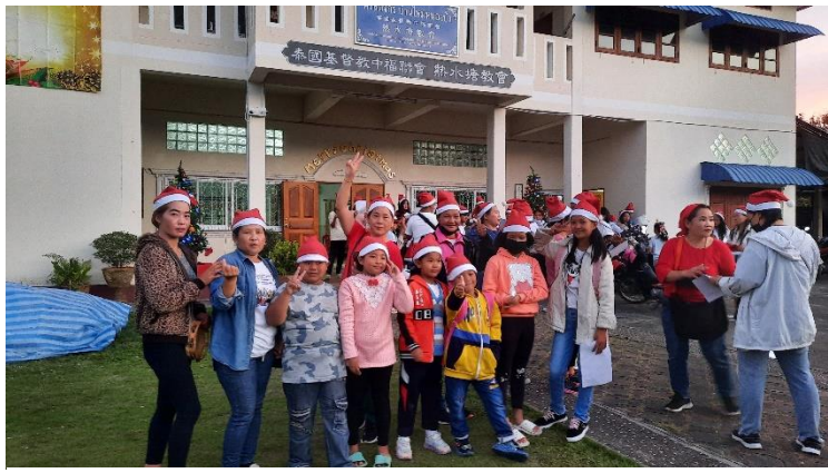
練習聖誕詩歌後 整裝待發去佈佳音