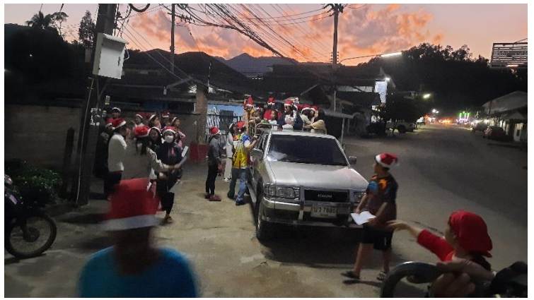
歌詠隊乘農夫卡車出發到村莊去