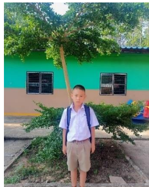
新加入的 7 名孩子