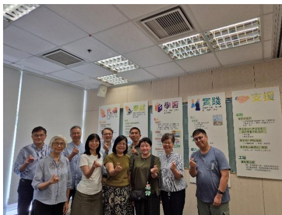
事工匯報後與差派教會和差會代表合照