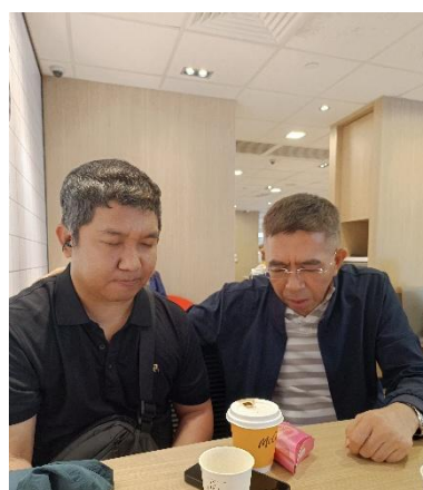
在香港與泰國傳道人相見 他是新天學生中心第一位奉獻服事主的學生 四年前中風 仍在治療中 昌達為他禱告