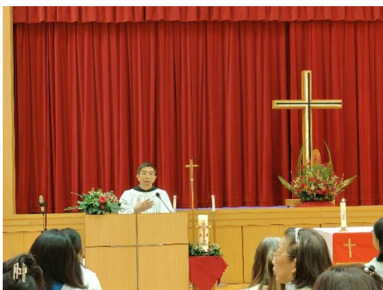
昌達在主日崇拜分享信息